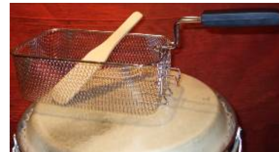
Frituurmand met spatel